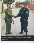
Raději symbol dvou různých mocností... (text partially obscured)