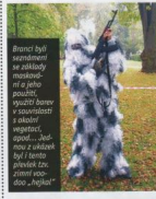
První byl spouštěč... (text partially obscured)